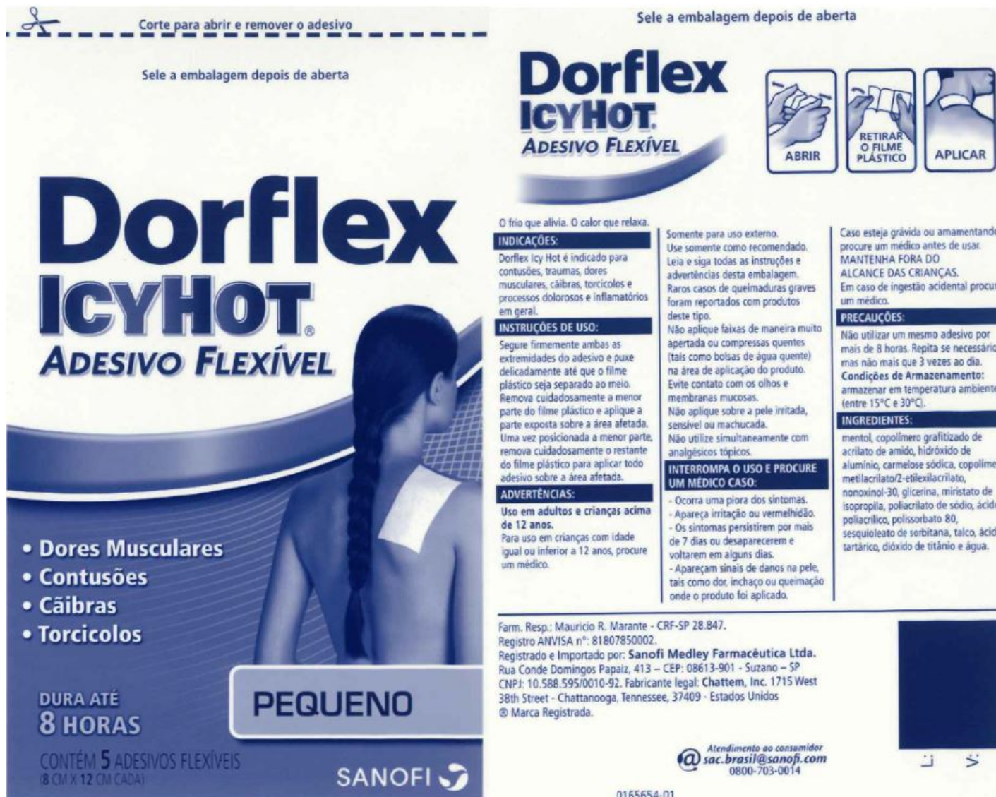
Pouch Label - Small